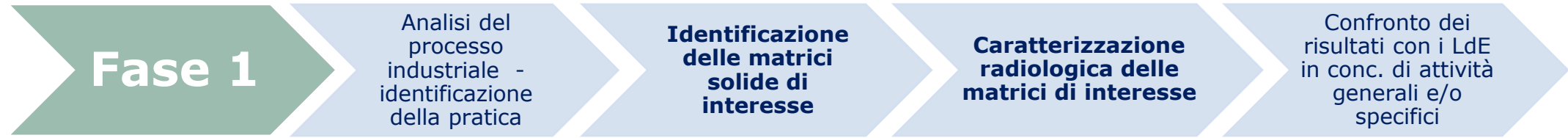
TABELLA I: MATRICI DI INTERESSE E CARATTERIZZAZIONE RADIOLOGICA