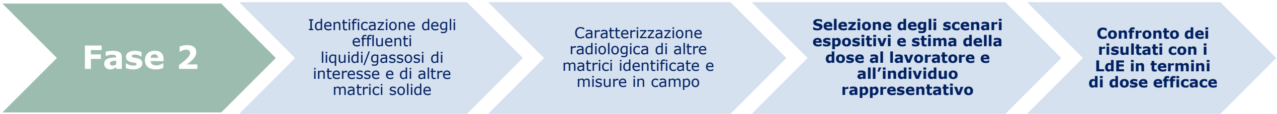
TABELLA IV: LAVORATORI – STIMA DELLA DOSE E VERIFICA ESENZIONE IN TERMINI DI DOSE EFFICACE